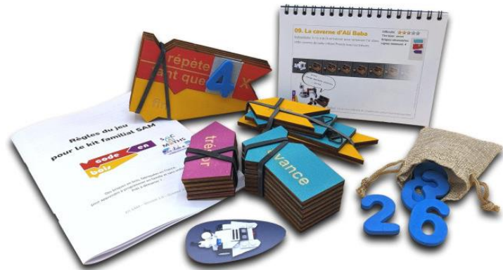
Le kit SAM développé pour sacs à maths